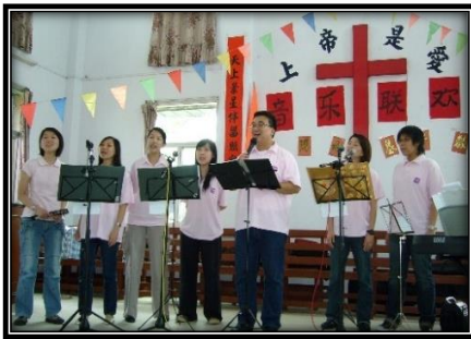
▲敬拜小組到潮汕佈道