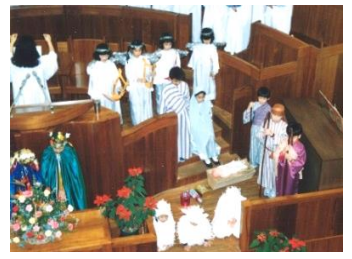
▲不同年代的聖誕聖景音樂劇