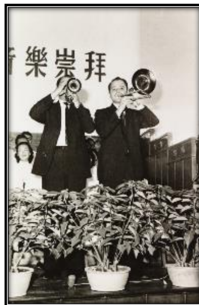
▲▼ 五十、六十年代的聖樂崇拜和音樂聚會