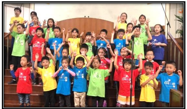
▲ 致力培育新一代敬拜者 — 兒童詩班