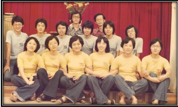
第一代 (90 年代)手鈴隊 ▶