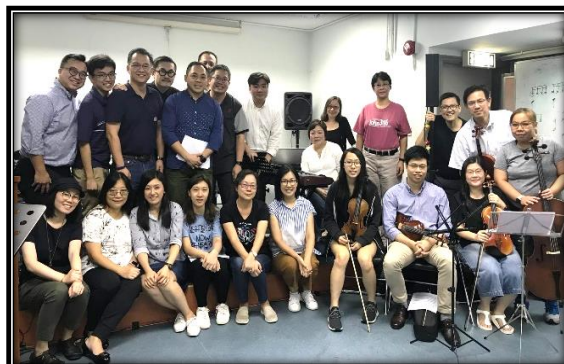
◀ 樂器組與聯合詩班接受「新心音樂事工」團隊訓練，準備 80 周年堂慶主題曲