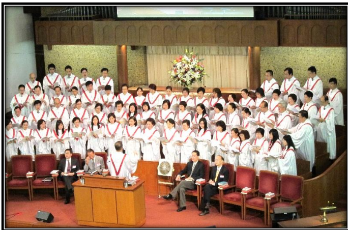
▲多年於港九培靈研經會獻唱