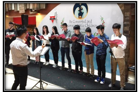
▲少年詩班於聖誕出外報佳音