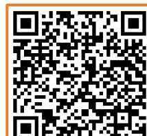
QR code 2