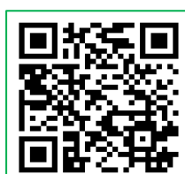
QR code 1

(義工服務詳情請掃描 QR code 3 或登入 http://www.lerc.org.hk/2019summerv )