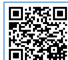
QR Code 3

中心在以下主日早/午堂後，設「暑期活動、暑期義工--查詢/報名站」，歡迎弟兄姊妹在聚會後到「查詢 / 報名站」了解詳情。「查詢/報名站」設置時間及地點：