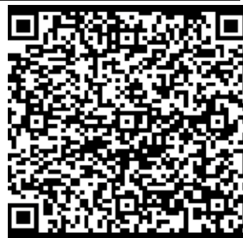
收聽沙田支堂堂慶詩歌