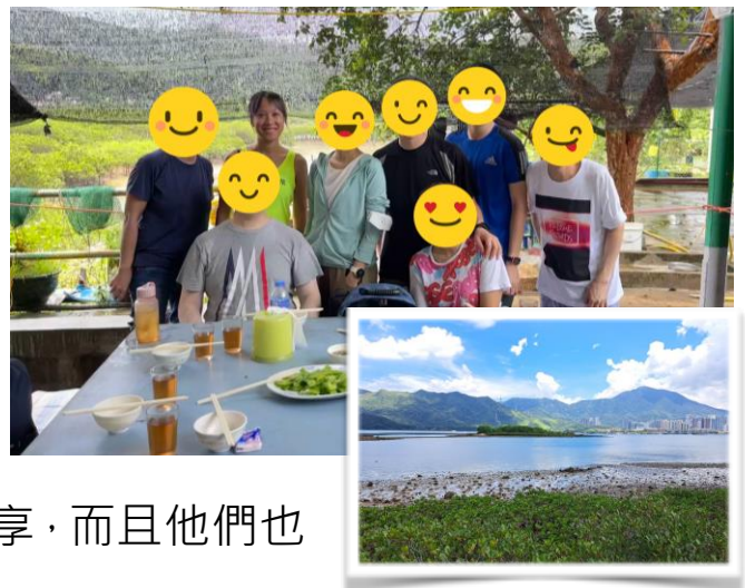
其中一位參加者拍攝的照片

另一件感恩的事就是在 6 月中我再次有機會負責了一個「心靈探索攝影之旅」的活動，在活動中與參加者分享如何透過光線、顏色、構圖、後製工具來表達情緒，以及讓他們在過程中有與自己或與神對話的空間。經過上年第一次舉辦的經驗，今次本來與同工們應該會有很好的分工，因為我們希望在郊遊的過程中可以分別地與參加者展開深入對話，但計劃趕不上變化，在活動前幾日有同事突然需要隔離及另一位同事也因為腳患而未能出席，所以最後只有我及一位同事負責是次活動，我心裡其實有少許再多少少的擔心，擔心未能夠有足夠人手去與參加者傾談；怎料到活動當天早上有兩位參加者因為身體抱恙而未能出席，最後是兩位同工+6位參加者，而當中有3位參加者是我與同工都不認識的，最終我們都有機會與他們(基督徒+未信者)展開一些深入對話，亦有機會談一些信仰話題，好感恩他們都很願意分享，而且他們也說比預期中更有收穫。