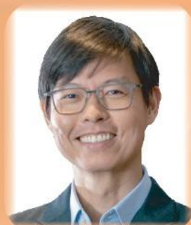
見證嘉賓 廖宜建弟兄 (匯豐銀行聯席行政總裁)