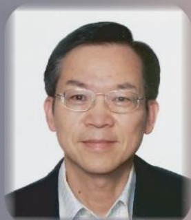
講員 楊柏滿牧師 (金融業福音團契顧問牧師、 香港浸信教會前主任牧師)