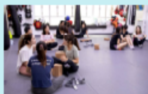
拉筋減壓班 - 在學習拉筋的過程中聆聽內心深處的聲音