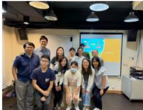
每季Ignite 職火晚會 - 透過不同的主題凝聚職場信徒，分享掙扎、同尋召命、再被燃點