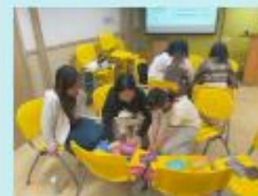
小組討論在職場環境傳福音的步驟