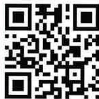
「一源聆聽聖經」手機應用程式