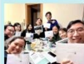
初職成長小組 - 認識上帝創造的自己及尋索人生使命