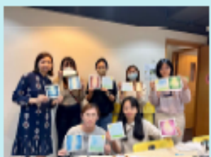
和諧粉彩班 - 透過藝術讓未信主的職青輕鬆分享生命