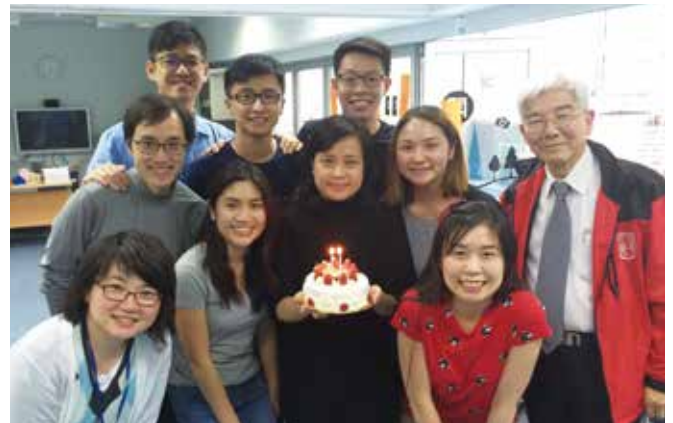
初職小組成員為楊國姿導師慶祝生日

在初職小組裡，我們會輪流帶查經或專題討論，從中學習時間管理和參與教會事奉，而導師就會從旁給予指導。我第一次帶小組查經就是在初職小組。我很享受那個過程，因為我可以在準備的期間率先研讀那些經文，這有助加深我對經文的印象。我們