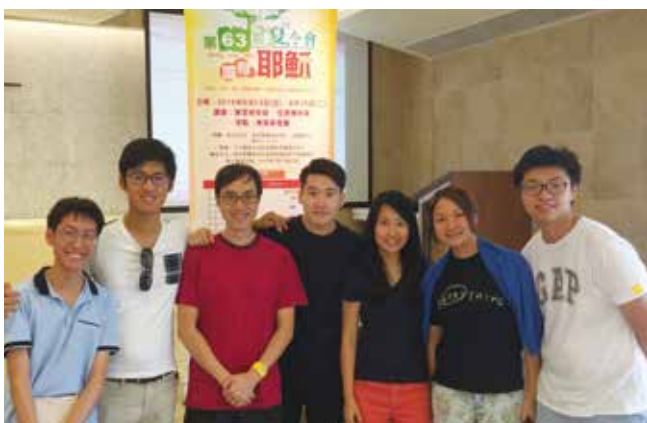
夏令營期間組員良好的互動促成了初職小組的成立

回想去年我參加夏令營的時候，營友每晚都會在小組裡分享自己當天在工作坊或培靈會中所學到的。由於大家想要分享的事情、感受太多，我們那一組每次討論都會超時。我們有聊不完的話題，又有許多疑問想要提出，熱烈的討論讓組員之間擦出無數火花，成為營會其中一個亮點。營會結束後，很多營友都渴望互動的火花可以延續，如此便造就了初職小組的成立。